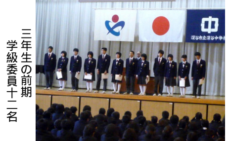
三年生の前期学級委員十二名

新年度早々の4月19日(金)の全校朝会で前期学級委員の任命式を行い、「任命証」をお渡ししました。