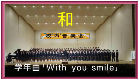
学年曲「With you smile」