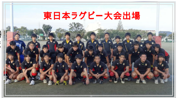
東日本ラグビー大会出場

今までの頑張りと努力を自信と誇りに替え、1つでも多く勝ち抜き、深谷中学校の名前を県外にも轟かせてほしいと思います。健闘を祈ります。