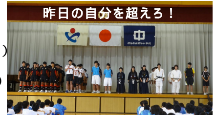
県大会出場壮行会(10月18日)