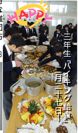
三年生バイキング給食(二月二十七日)