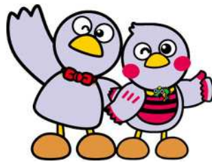
埼玉県マスコット 「コバトン」「さいたまっち」