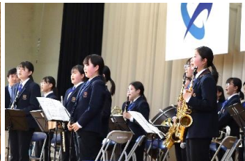
4月13日 部活動説明会