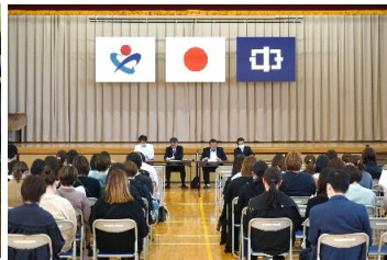
4月22日 授業参観 PTA総会 学級懇談会