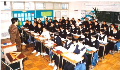
授業風景(1クラス43人もいました)