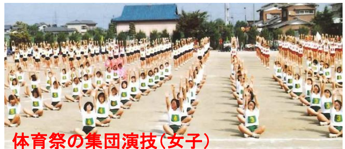
体育祭の集団演技(女子)