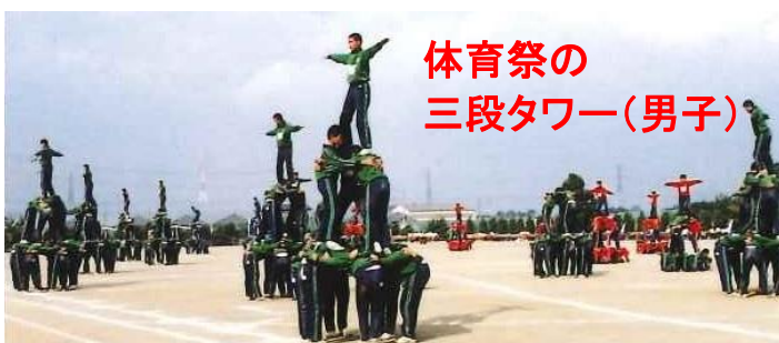
体育祭の 三段タワー(男子)