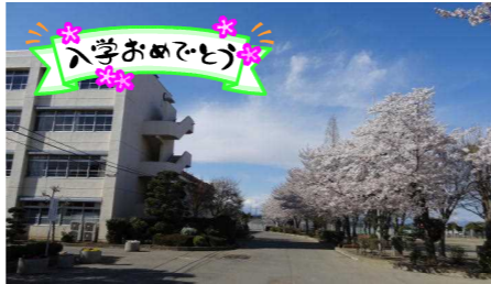
※ 慶雲：めでたいことが起こる前兆の雲

4月1日は、春爛漫の快晴。正門にある桜も花開き、その枝に止まる野鳥も桜花爛漫を満喫しているようでした。ふと空を見上げると、今年度も、風光る青空にフワリとした雲を桜の小枝の隙間から望むことができました。その雲は、平成26年度の一年間を躍進させる深中の「慶雲」に違いありません。嬉しい限りです。平成26年度は、生徒数496名でのスタートとなります。