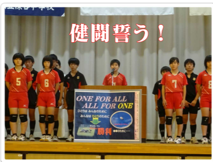
【県大会出場壮行会(10/16)】