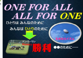
ふれあい人権セミナー(10/18)