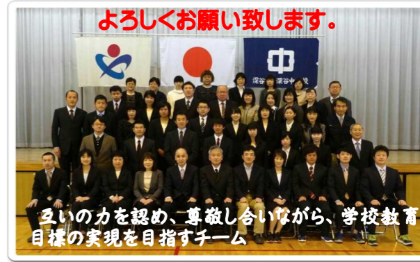
互いの力を認め、尊敬し合いながら、学校教育目標の実現を目指すチーム