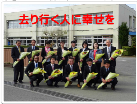
去り行く人に幸せを