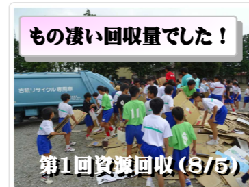
もの凄い回収量でした！